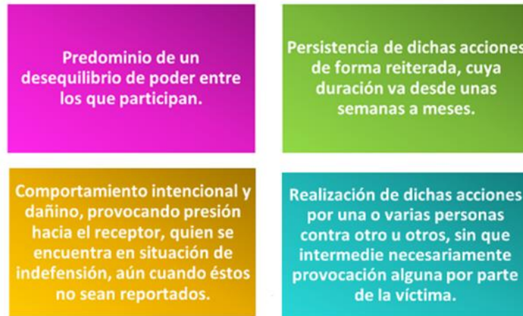
Ilustración 2. Identificación de acoso escolar.